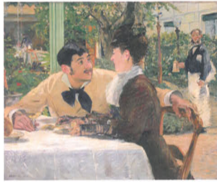
f. 《ラトゥイユ親父の店》 1879年 油彩、カンヴァス トゥルネ美術館