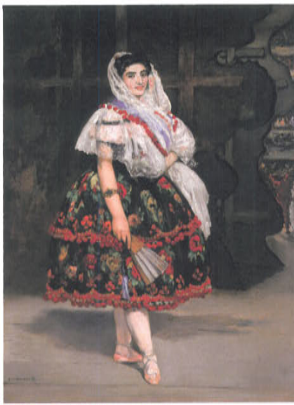
b. 《ローラ・ド・ヴァランス》 1825年 油彩、カンヴァス オルセー美術館