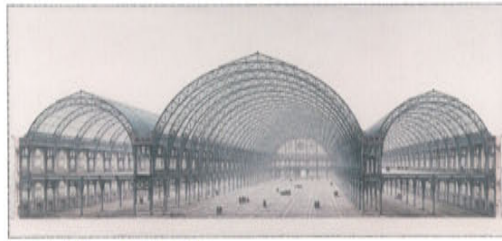
i. マックス・ベルトラン 《産業館(断面図)》 1894年 ペンと黒インク、水彩 オルセー美術館