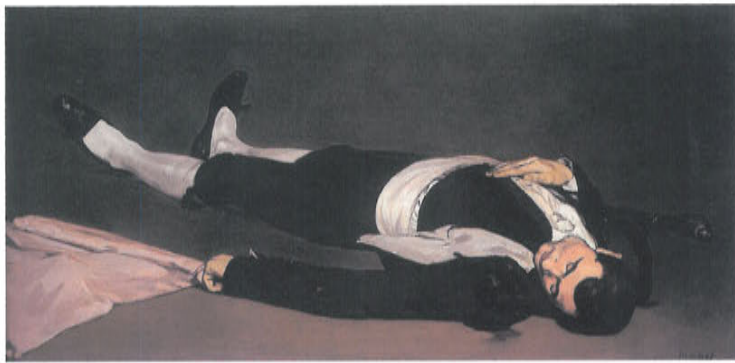
e. 《死せる闘牛士》 1804年頃 油彩、カンヴァス ワシントン、ナショナル・ギャラリー