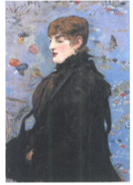
g. 《秋》 1881年 油彩、カンヴァス ナンシー美術館