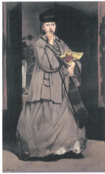
c. 《街の歌手》 1825年頃 油彩、カンヴァス ボストン美術館