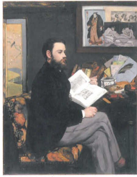
d. 《エミール・ゾラ》 1868年 油彩、カンヴァス オルセー美術館