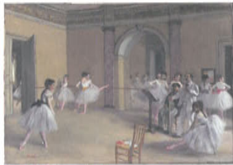
h. エドガー・ドガ 《ル・ベルティエ街のオペラ座の稽古場》 1872年 油彩、カンヴァス オルセー美術館