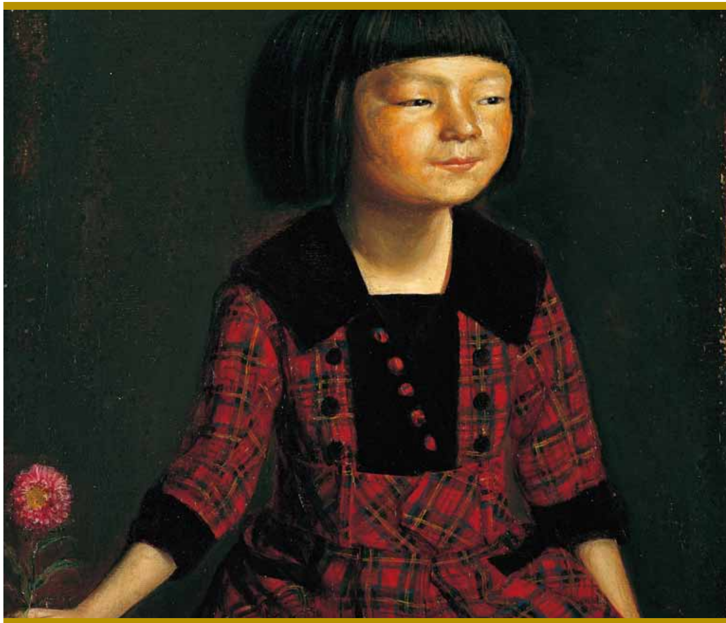
岸田劉生《童女像(麗子花持てる)》1921(大正10)年 個人蔵

FROM DREAM TO REALITY THE IWASAKI / MITSUBISHI COLLECTION